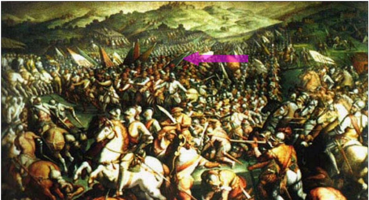
La battaglia di Scannagallo

L'interno del Salone dei Cinquecento a Palazzo Vecchio a Firenze. Parete di fondo: fino ad un'altezza di circa due metri la parete è bianca, una cornice la divide dall'affresco che rappresenta "La battaglia di Scannagallo" di Giorgio Vasari, i quale occupa il resto della scena di fondo. Davanti all'affresco, spostata sulla destra della scena un'impalcatura che arriva a circa metà del dipinto. Parete di sinistra a quinte, da una delle quali, una lunga striscia di luce proiettata sul pavimento, simula l'apertura di una grande porta che si apre fuori scena. Sulla destra: altre quinte. (Nota: l'affresco ovviamente può essere anche riprodotto sullo sfondo della scena proiettando una diapositiva dell'opera)